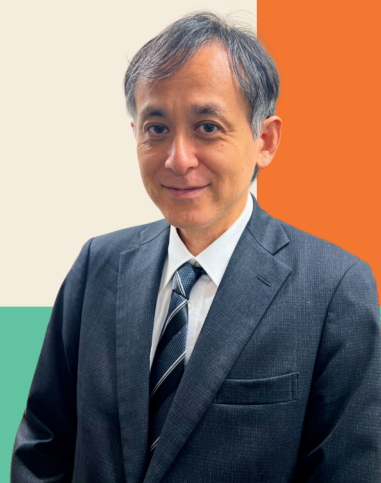
弁護士・社会福祉士

急なご病気による入院や施設入所など、 将来に向けて備えるべきこと、遺言書や 相続などについて、お一人暮らしの方も、 親族がいる方もそれぞれ事例を交えながら 福祉と法律の両面からお話しします