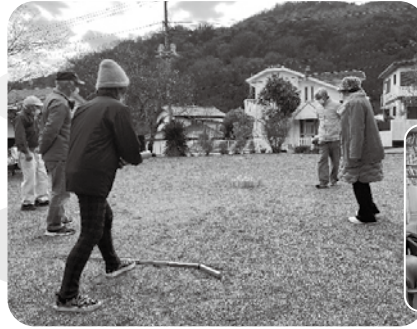
屋外でのモルック体験(湯の沢自治会)