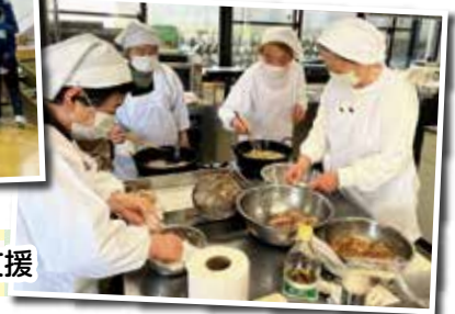
各種ボランティア支援