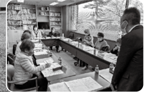
リーダーの方々による 情報交換