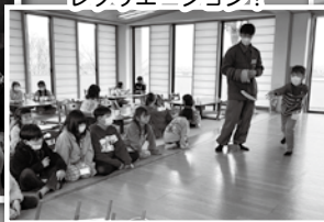
レクリエーション!