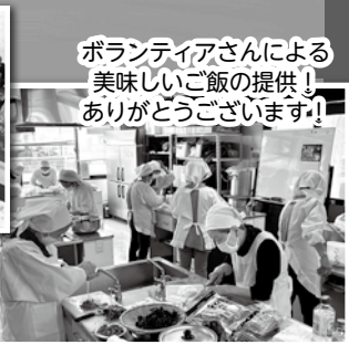
ボランティアさんによる 美味しいご飯の提供! ありがとうございます!