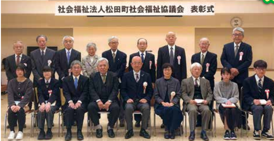
社会福祉法人松田町社会福祉協議会 表彰式

3月10日(日)松田町生涯学習センターにて本会の表彰式を行いました。令和5年度に福祉功労者として、本会より表彰状、感謝状と記念品を下記の方々に贈呈させていただきました。