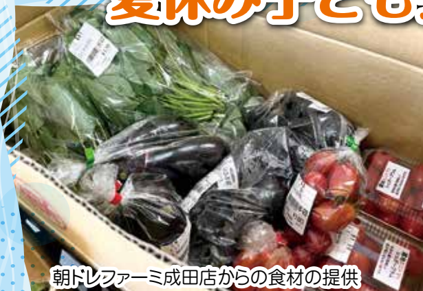
朝ドレファーマ成田店からの食材の提供

今年も多くの方々のご協力により、5回にわたり子ども会食会が実施できました。7月下旬よりコロナ感染者増により、会食会からお弁当配付に切り替えて実施しました。