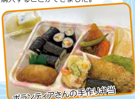
ボランティアさんの手作り弁当