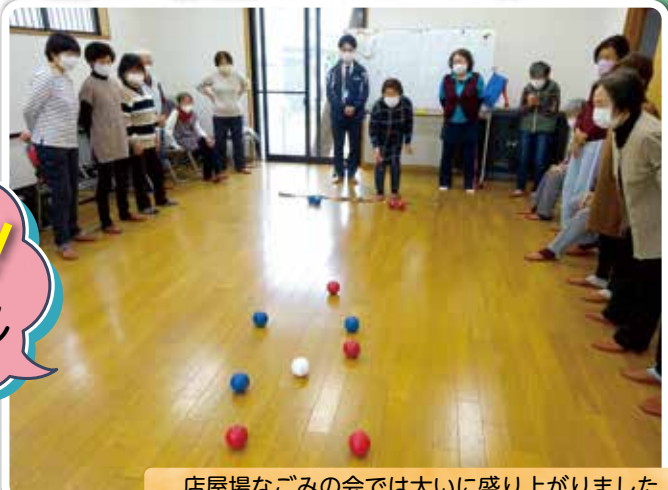
店屋場なごみの会では大いに盛り上がりました