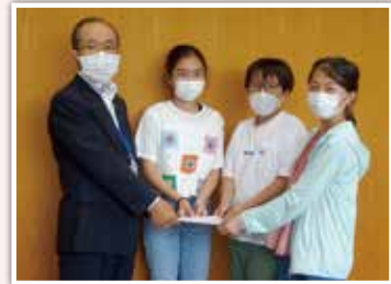
生涯学習センターまつりのバザーにて募金箱の募金をご寄付いただきました。