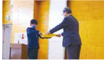
町社協会長より賞状の伝達