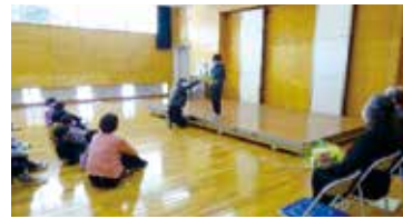
全校児童の前で発表