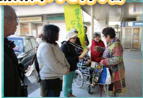
(令和元年度KOMNYすみれの家による募金運動)